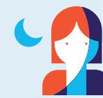
Travail de nuit 120 nuits par an