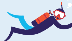
Travail en milieu hyperbare 60 interventions par an