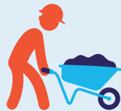
Manutentions manuelles de charges