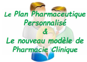
Figure 1 : Le nouveau modèle de pharmacie clinique – SFPC 2017